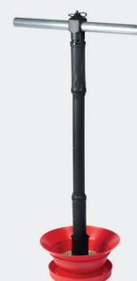
MANGEOIRE HAUTE AVEC COLLERETTE